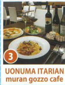
3 UONUMA ITALIAN muran gozzo cafe