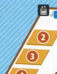
20 and tap CAFE