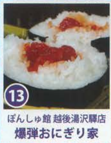
13 ほんしゅ館 越後湯沢駅店 爆弾おにぎり家