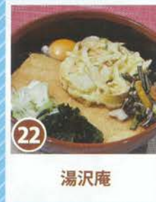
24 マツモトキョシ 越後湯沢駅分店

どこが懐かしく、あたたかい... 雪国情緒あふれる がんぎどおりをお楽しみください。