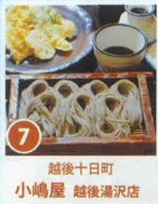
7 越後十日町 小嶋屋 越後湯沢店