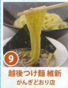
9 越後つけ麺 維新 がんぎどおり店