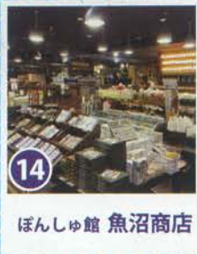
14 ほんしゅ館 魚沼商店