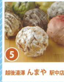
5 越後湯澤 んまや 駅中店