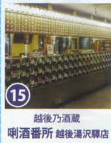
15 越後乃酒蔵 喇番所 越後湯沢駅店