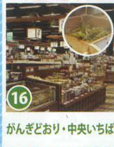
16 がんぎどおり・中央いちば