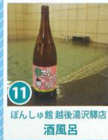
11 ほんしゅ館 越後湯沢駅店 酒風呂