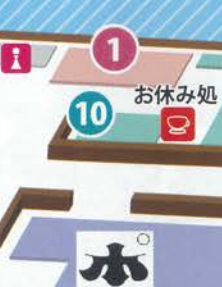
21 RESORT EX-SPO