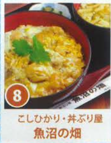
8 こしひかり・井ぶり屋 魚沼の畑