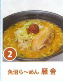
2 魚沼ら〜めん 雁舎