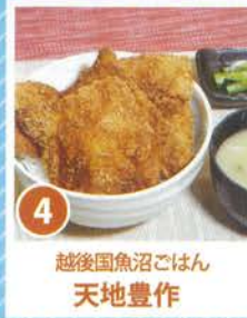
4 越後国魚沼ごはん 天地豊作