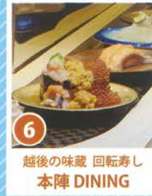
6 越後の味蔵 回転寿司 本陣 DINING