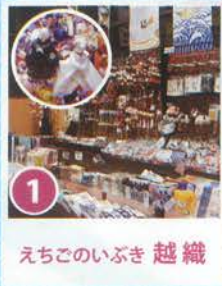
1 えちこのいぶき 越織

新潟のお土産や食事処が勢揃い! お酒やお菓子など何でも揃っているので、新幹線に乗るまでの待ち時間を楽しく過ごせます!