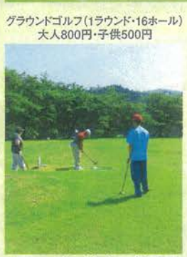
グラウンドゴルフ(1ラウンド・16ホール) 大人800円・子供500円