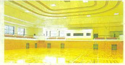
スポーツ合宿やイベントもOKのアリーナ