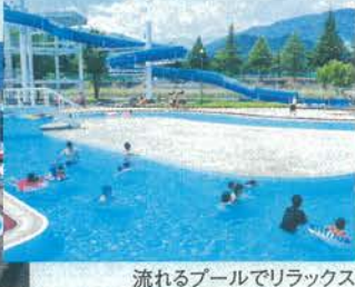
流れるプールでリラックス