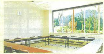
各種ミーティングができる会議室

開館時間 9:00～21:30(日曜日は17:00まで) 休館日 12月31日～1月3日 湯沢カルチャーセンター使用料