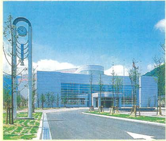
知と健康のカルチャーセンター