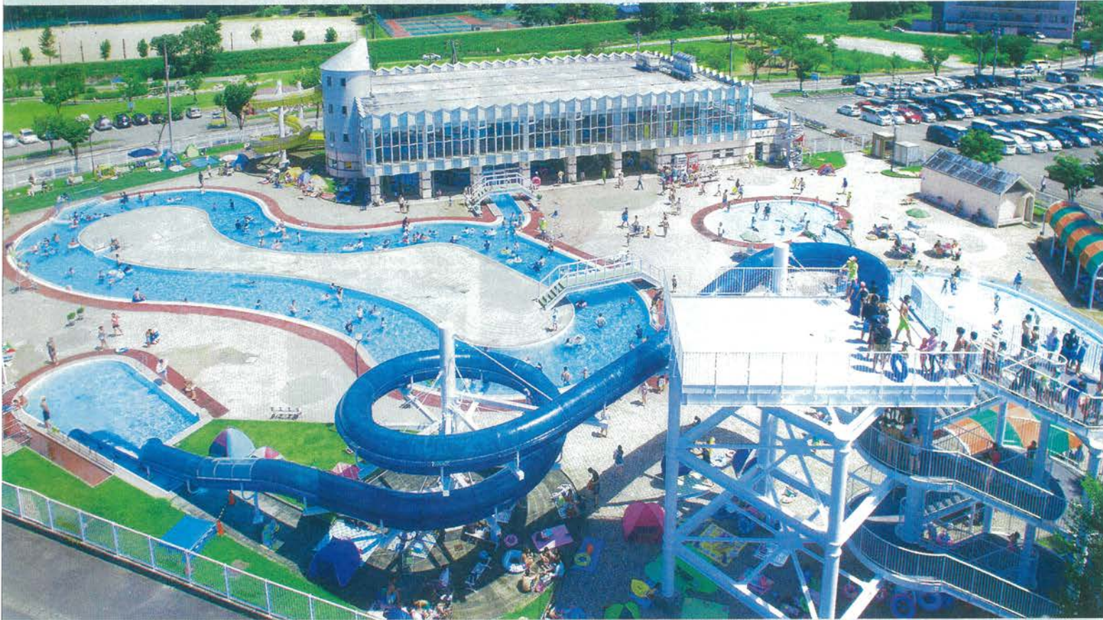
お子様は アドベンチャーロックスライダーへ

山に囲まれた湯沢のアクアリゾート、それがレジャープール「オーロラ」。屋外と屋内にひとつずつの流れるプールでユラユラのんびり泳いで、スリルを楽しみたいならウォータースライダーへ。小さなお子様も安心して楽しめるプールもあるので、家族みんなで楽しめます。