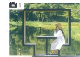
あやめヶ池のフォトスポット