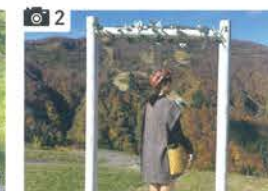
小花の道のフォトスポット