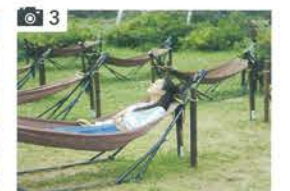
ハンモックススペースでゆっくりと