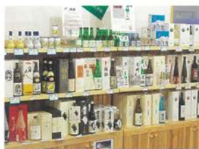
地元酒蔵の銘酒もあります。