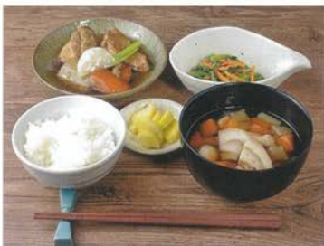
やわらか越後もちぶたとコシヒカリ

釜で炊いた南魚沼産コシヒカリを、おむすびや定食・丼で楽しめます。たっぽ家名物「どんそば」は、コシヒカリの米粉麺にタレ・具材を混ぜて食べるのが特徴。その他、津南高原ミルクソフトや和甘味、ドリンクもあり、カフェとしても楽しめます。