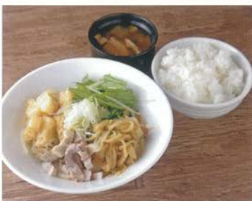
たっぽ家名物「どんそば定食」