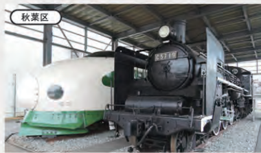
秋葉区 新潟市新津鉄道資料館 地図 P28 D-3

大広間から見る美しい庭園は必見！ 伝統と芸術が息づく豪農の館 越後の大地主・伊藤家の邸宅を博物館として公開。敷地面積8,800坪、建坪1,200坪、部屋数65を数える大邸宅が栄華を極めた豪農の歴史を物語る。 ② 新潟市江南区沢海2-15-25 ☎ 025-385-2001 ③ 9時～17時※12月～3月は16時30分まで ④ なし ⑤ 入館料/大人800円、小・中学生400円(小・中学生は日曜・祝日無料)