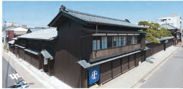
新潟市歴史博物館みなとぴあ 地図 P30