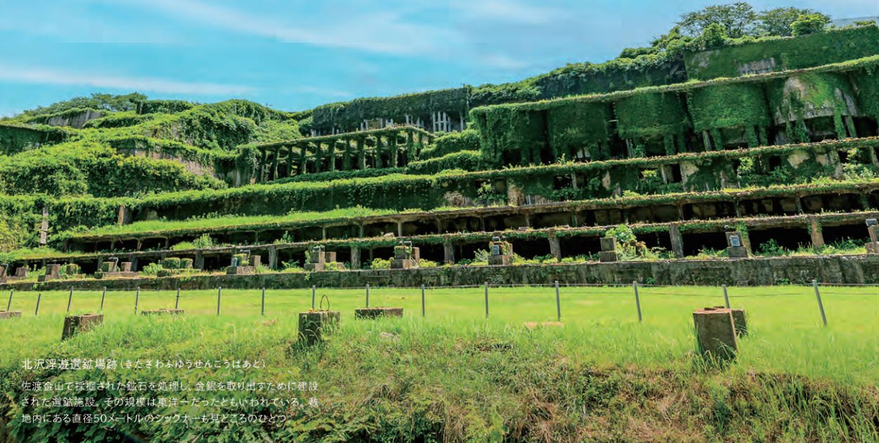
北沢浮遊遊館跡(きたさわふゆうせんこうばあと) 佐渡金山で採掘された鉱石を処理し、金銀を取り出すために建設された遊館施設。その規模は東洋一だともいわれている。敷地内にある直径50メートルのツググナーも見どころのひとつ

日本海側最大の島、佐渡島。美しい自然と生態系、貴族・武家・町人の3つの文化が融合した独自の伝統文化、佐渡の気候風土が生み出す豊かな食文化が息づく佐渡は、「日本の縮図」とも呼ばれている。