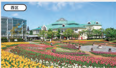
西区 新潟ふるさと村 地図 P28 D-2

見て！食べて！体験できる！ 米どころ新潟のせんべいテーマパーク 職人がせんべいを焼く様子を見学でき、自らも体験して味わうことができる、せんべいのテーマパーク。イチオシは「超特大お絵描きせんべい焼き体験」。 ② 新潟市北区新崎2661 ☎ 025-259-0161 ③ 平日9時30分～16時(体験受付15時30分まで)、土・日曜、祝日9時30分～17時(体験受付16時まで) ④ 不定休※臨時休業あり。火曜を定休日にする場合あり ⑤ 入場無料、超特大お絵描きせんべい焼き体験1枚/大人1名(中学生以上)1,500円、お子様1名(未就学児～小学6年生)1,200円