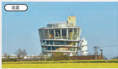
北区 水の駅「ビュー福島潟」 地図 P28 F-3

日本海側有数の規模を誇る水族館 家族で楽しめるイベントや特別展示も！ 600種2万点の水生物を観察できる、日本海側有数の規模を誇る水族館。日本海大水槽や新潟の里山の風景を再現した屋外展示など、見どころ満載！ ② 新潟市中央区西船見町5932-445 ☎ 025-222-7500 ③ 9時～17時(夏季は延長の場合あり。入館は閉館の30分前まで) ※レストランは10時30分～閉館40分前LO ④ 12月29日～1月1日、3月の第1木曜とその翌日 ⑤ 高校生以上1,500円、小・中学生600円、4歳以上200円、3歳以下無料、年間パスポート/高校生以上3,500円、小・中学生1,300円、幼児(4歳～)400円