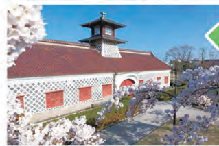
旧新潟税関庁舎 地図 P30

明治2年(1869年)に建てられた、開港5港当時の税関として現存する唯一の建物。左右対称、塔やアーチなど、西洋建築の要素を日本建築の技術で表現している。