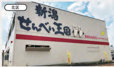
北区 新潟せんべい王国 地図 P28 E-2

福島潟を一望できる大パノラマ！ 潟の歴史や動植物を紹介する情報発信施設 国の天然記念物「オオシクイ」や希少植物「オニバス」を中心に、潟の動植物などを紹介する施設。屋上からは福島潟と越後平野の風景を楽しめる。 ② 新潟市北区前新田乙493 ☎ 025-387-1491 ③ 9時～17時(入館は16時30分まで) ④ 月曜(祝日の場合は翌日)、年末年始 ⑤ 4F～7Fの入館料/大人400円、小中高生200円